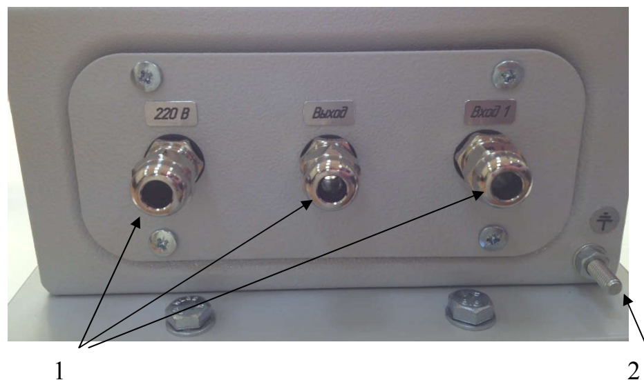
Рис.3 - Вид на БПЭС со стороны кабельных вводов. 1- гайка кабельного ввода; 2 – шпилька заземления.